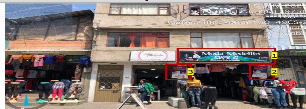
Fotografía No. 1

Fachada del establecimiento comercial denominado MODAS MEDELLÍN SPORT G ubicado en la CR 88 C No. 49 C - 32 SUR , en la que se puede evidenciar: un (1) elemento publicitario tipo “ aviso en fachada ” instalado sin contar con el registro ante la Secretaría Distrital de Ambiente , identificado con el número 1 . De igual forma se observa dos (2) elementos publicitarios adicionales en relación al único permitido por fachada de establecimiento identificados con los números 2 y 3 .